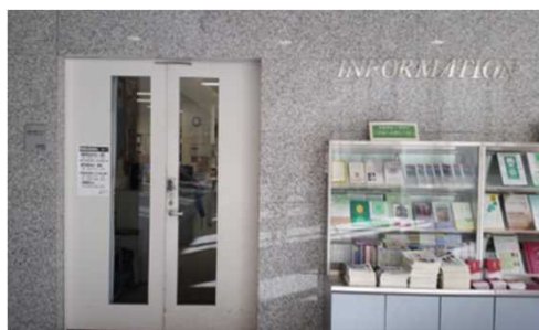
← 2号館1階 ICT授業支援デスク入口 (環境整備グループ室内)

※目白聖母キャンパス教室の使用については、目白聖母キャンパス1号館2階202作業室に確認してください。