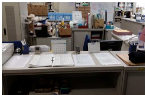
← 2号館1階 ICT授業支援デスク受付窓口